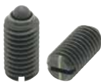
ZSP (轻载荷用 识别:1根线)