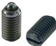
SPLH (重载荷用 识别:2根线)