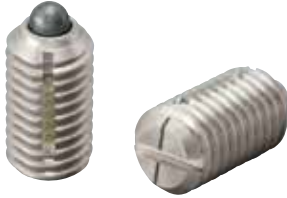
LSPLL-SUS (轻载荷用) 识别: 1根线