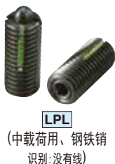
LPL (中载荷用、钢铁销 识别: 没有线)