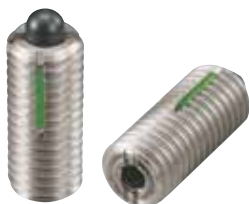
LPLH-SUS (重载荷用 识别: 2根线)