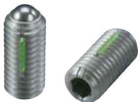
LBSUH-A (重载荷用 识别:2根线)