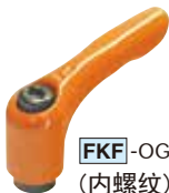
FKF -OG (内螺纹)