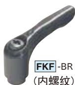
FKF -BR (内螺纹)