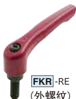
FKR -RE (外螺纹)