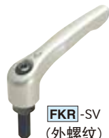
FKR -SV (外螺纹)