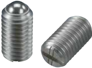
BSUH (重载荷用 识别:2根线)