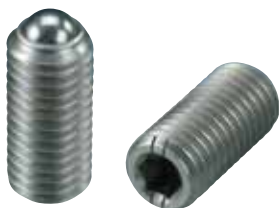
BSUH-A (重载荷用) 识别:2根线