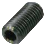
BSTH-A (重载荷用 识别:2根线)